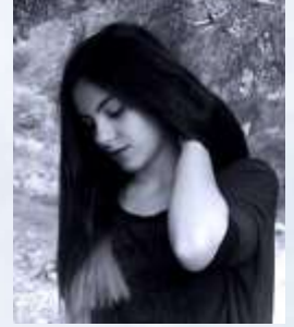
Από την Αφροδίτη Εξερτζή

Αντιπροσωπείες από τις Η.Π.Α, Τουρκία, Γερμανία, Κύπρο, Μ. Βρετανία και Κορέα παρουσίασαν τα δικά τους μοντέλα, αλλά και τον τρόπο που λειτουργεί η Φροντιστηριακή εκπαίδευση ανά τον κόσμο.