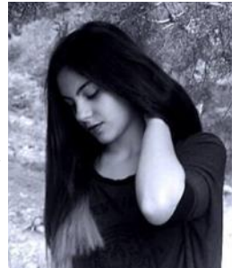
Από την Αφροδίτη Εξερτζή

Αξιοποιούν οι μαθητές τον ελεύθερό τους χρόνο στις μέρες μας με διάφορες δραστηριότητες ή οι σχολικές εργασίες είναι τέτοιες που δεν το επιτρέπουν; Πόσο σημαντικός είναι ο ελεύθερος χρόνος για την ομαλή ανάπτυξη του ατόμου, τόσο σε ψυχικό, όσο και σε πνευματικό, αλλά και σωματικό επίπεδο; Το σχολείο προτρέπει τον μαθητή να πράξει ελεύθερα, τις ημέρες οι οποίες προορίζονται για ξεκούραση και εκτόνωση;