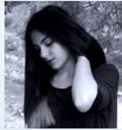
Από την Αφροδίτη Εξερτζή

Το θέατρο σε όλες τις βαθμίδες της εκπαίδευσης, δεν είναι μόνο ωφέλιμο, αλλά και αναγκαίο, για τους λόγους που προανέφερα.