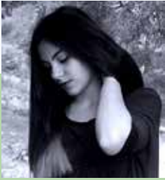
Από την Αφροδίτη Εξερτζή

Συζητήσαμε με τρεις ενήλικες επιτυχόντες των Πανελληνίων Εξετάσεων 2019, προκειμένου να μοιραστούν μαζί μας τις σκέψεις και τα συναισθήματά τους από τη συνολική διαδικασία των εξετάσεων.