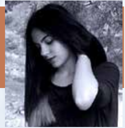
Από την Αφροδίτη Εξερτζή

Μια από τις βασικές αλλαγές που επιφέρει η ψήφιση του νομοσχεδίου Γαβρόγλου είναι, μεταξύ άλλων, η αντικατάσταση του μαθήματος των Λατινικών από το μάθημα της Κοινωνιολογίας στις επόμενες Πανελλήνιες Εξετάσεις για τους υποψηφίους των ανθρωπιστικών σπουδών.