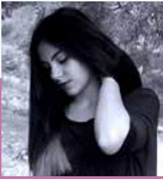
Από την Αφροδίτη Εξερτζή