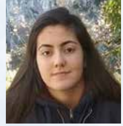
Από την Ελισάβετ Λάμτζια

Αν είσαι λάτρης της περιπέτειας και του μυστηρίου πρέπει να προσθέσεις άμεσα στην συλλογή σου το νέο βιβλίο του Stefan Ahnhem! Ο Σουηδός συγγραφέας έρχεται να μας καθηλώσει με το πολλά υποσχόμενο αστυνομικό μυθιστόρημα Χωρίς Πρόσωπο.