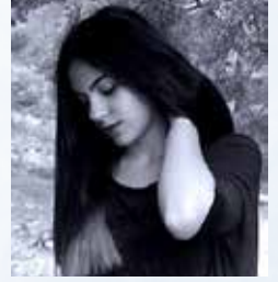
Από την Αφροδίτη Εξερτζή

«Μου άρεσε που οι ρυθμοί της ζωής μας έγιναν πιο φυσιολογικοί, που παρ' όλο που είχα πράγματα να κάνω, πλέον δεν είχα τόσα, ώστε να σχεδιάζω πρόγραμμα για το πώς θα τα προλάβω, πώς θα προλάβω να εκμεταλλευτώ και να αξιοποιήσω και το 10λεπτο μεταξύ δύο δραστηριοτήτων. Που δε χρειαζόταν να φοράω ρολόι.»